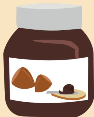
Pâtes à tartiner