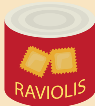
Viande et plats préparés