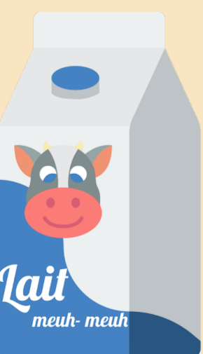
Laits et boissons végétales